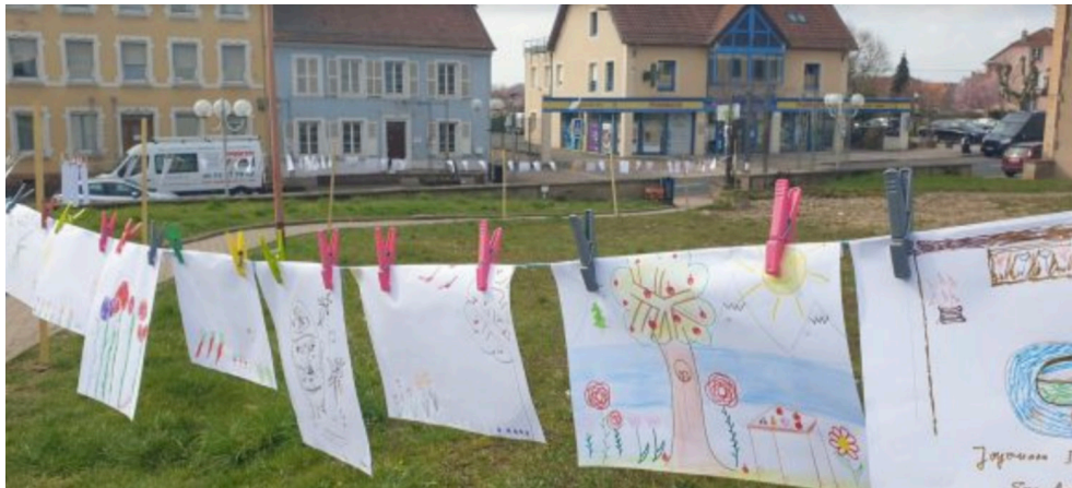
« La Grande Lessive » - 11 millions de participants - Sensibilisation à la nature Un jour par an, dans tous les pays et à Sarre-Union.