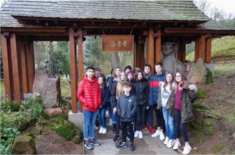
Les élèves de 3 è au Temple Zen de Weiterswiller.

par les professeurs d'Enseignement Religieux.